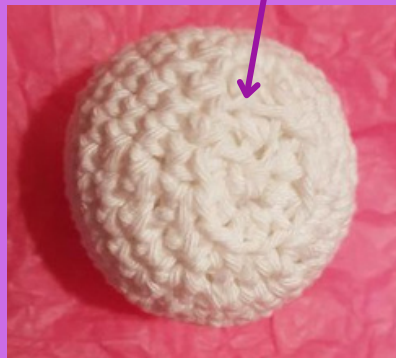
Tête vue de dessous