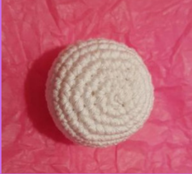
Tête vue de dessus