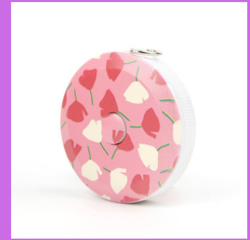
Un mètre de couturière