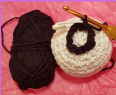
Crocheter à partir du rang n°15 sous la tête