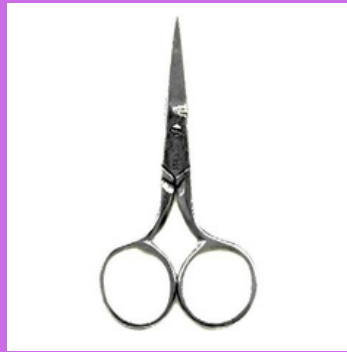
Un ciseaux de broderie