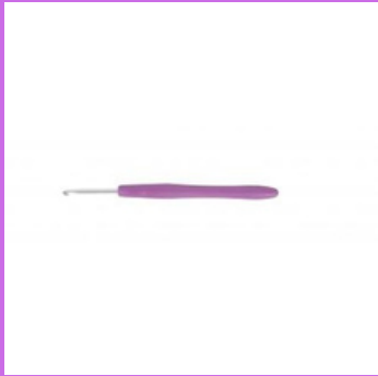
Un crochet *