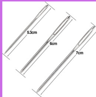
Aiguille à laine